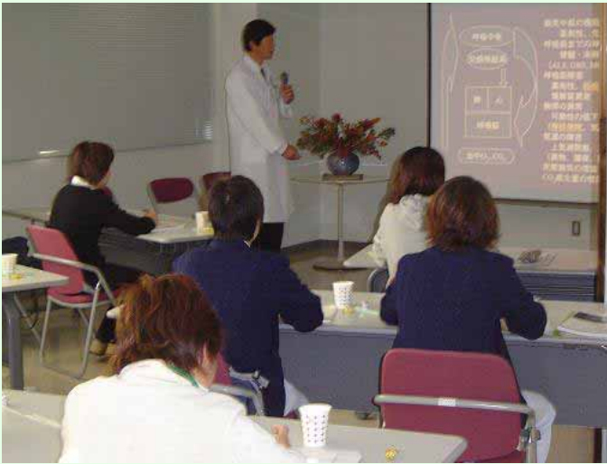
「人工呼吸器の仕組みについて」の講義

昨年11月17日に近隣の訪問看護ステーション職員を対象とする人工呼吸器講習会が開催されました。西多賀病院では100台を超える人工呼吸器が患者様に装着されておりますが、この数字は1つの病院としては恐らく世界で1番多い台数であると思われま。入院されている患者様が安心して外泊・外出ができるように、当院では「外出・外泊の判断基準」を作成しております。その判断基準の1つとして、人工呼吸器を安全に管理できる付添者が必要とされておりますが、なかなか人材が不足しているのが現状です。そこで、今後近隣の訪問看護ステーションの職員の方を対象とした人工呼吸器の講習会を定期的に行うこととしました。今回は病棟で患者様に人工呼吸が装着されている状態を見ていただき、更には実際に人工呼吸器に触れて頂いて理解を深める講習会としました。在宅で療養をされている患者様の中にも人工呼吸器を使用している患者様が増えてきております。次回は年明けに計画いたしますので、多数の参加をお願いいたします。