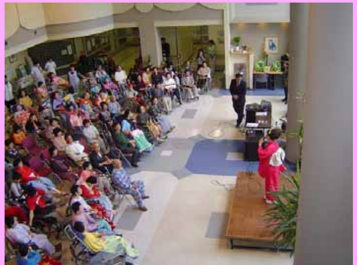
外来ホールに大勢の患者様が集まりました。

また機会がありましたら同様のコンサートを開催し、患者様に潤いのある入院生活を送っていただけるよう企画したいと考えております。