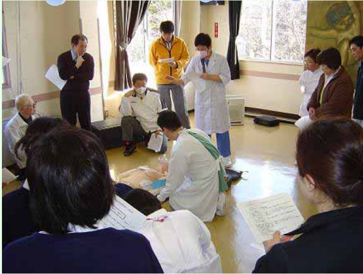
講習会には隣接する西多賀養護学校の教師の皆様方も参加していただきました。(中央が麻酔科医長です。)

昨年、厚生労働省が一般の人に突然の心停止に有効な自動体外式除細動器(AED)の使用を認める方針を打ち出しました。